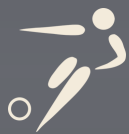
FOOTBALL voir P 13