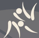
JUDO voir P 5

Vous trouverez ci-dessous l'ensemble des sports accessibles aux enfants (- de 12ans) sur le territoire de la commune de Verlainne.