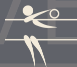
VOLLEY-BALL voir P 19