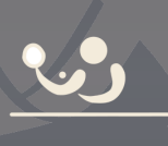
TENNIS DE TABLE voir P 18