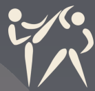
KARATE voir P 5