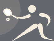
TENNIS voir P 18